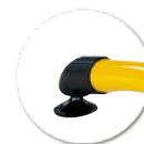
Vérin de réglable