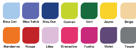
Nuancier mousse PVC

NB : Espace adapté pour enfant 0-18 mois