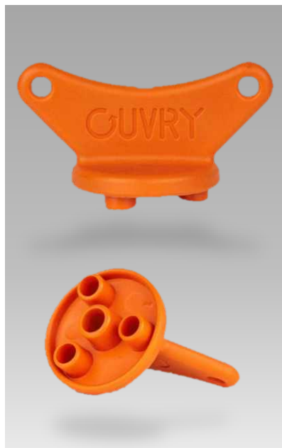
Réf. : 109024AA-U Clef de montage du bouchon - masque O'C50/FM53 - orange - (Pack de 5)