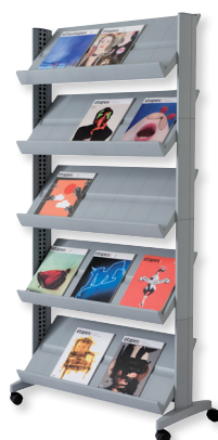
255N.35 teinte alu