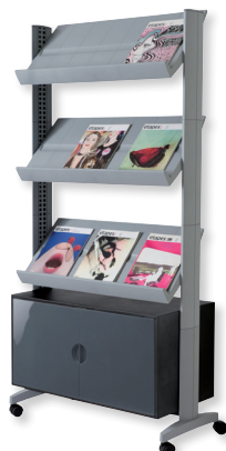
UPP43.35 teinte alu