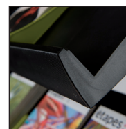
Rebord de tablette : 4 cm