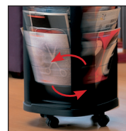
Rotatif à 360°