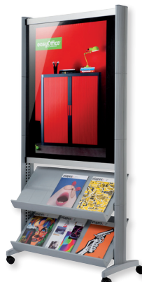
SPP1.35 teinte alu