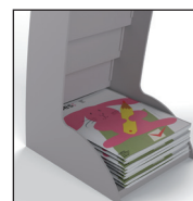
Espace de stockage à l'arrière du présentoir