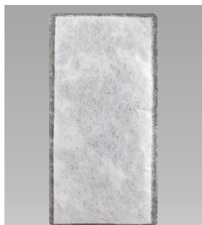
Réf. : 600006AA-U