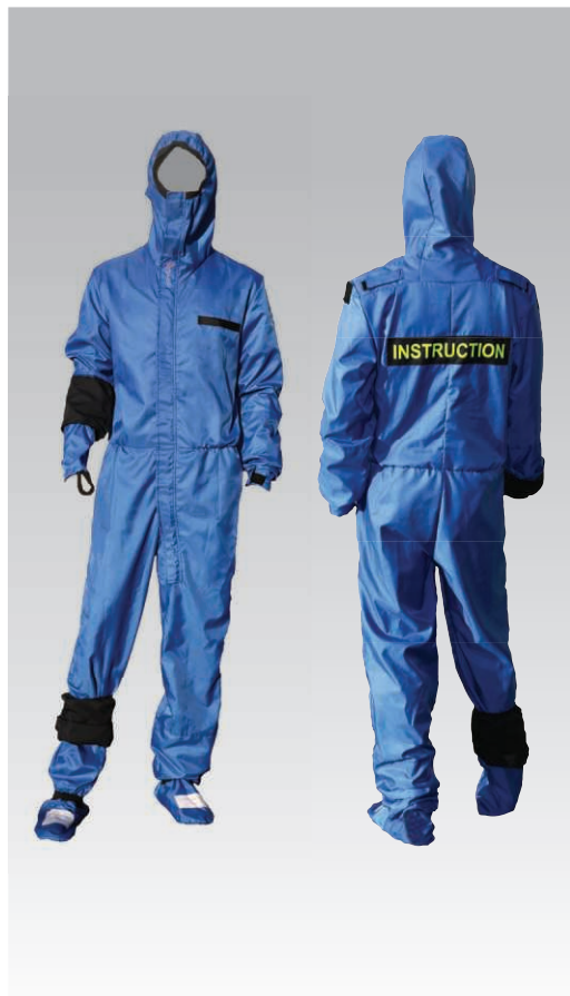
Réf. : 740540AA