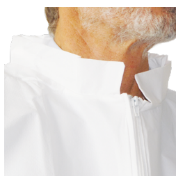
Col mandarin doublé