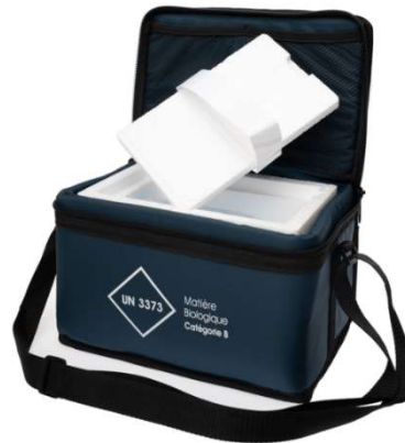
SodiBag IDE 9L + caisson 2,7L