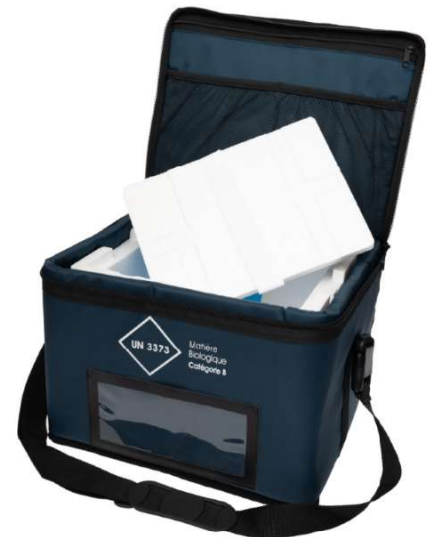
SodiBag IDE 26L + caisson 9,2L