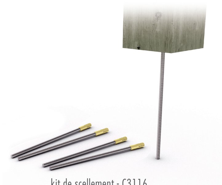
kit de scellement - C3116