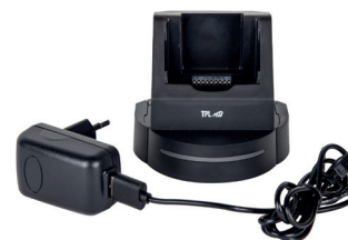
Chargeur de bureau