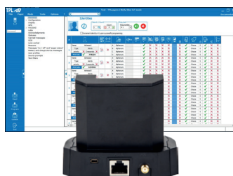
Kit de programmation