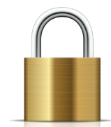
Option : logiciel d'encryption Secure Paging Protocol en AES256