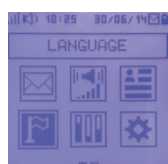
Interface utilisateur amicale Écran couleur rétroéclairé