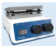
plaque chauffante US152D

Surveillez de près vos paramètres. L'affichage numérique indique clairement la température de la plaque chauffante en service.