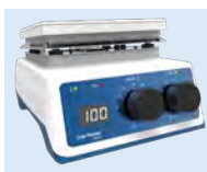
plaque chauffante UC152D