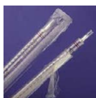
En plastique clair