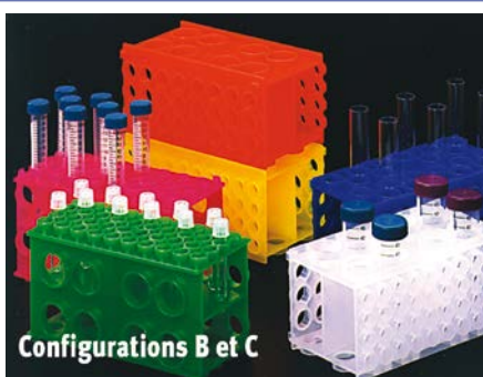
Configurations B et C