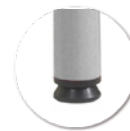
Vérins de réglage