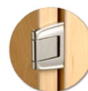
Ouverture à 270°