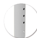
Réglable en hauteur