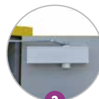
2 Ferme-porte avec thermofusible