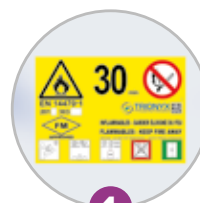
1 Pictogramme normalisé