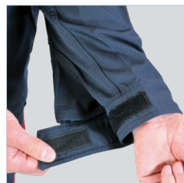
Bas de manches réglables