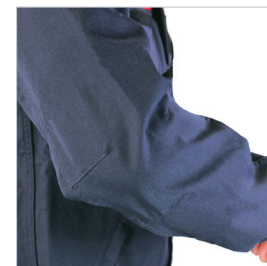
Manches montées avec coudes préformés.