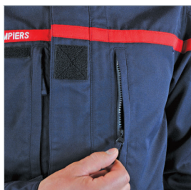
Poches zippées poitrine et inférieures