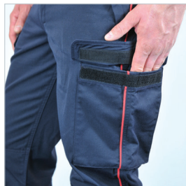
Poches avec rabat auto- agrippant sur les cuisses