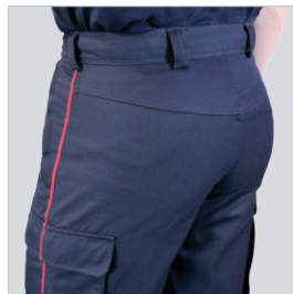
Coupe réhaussée au dos