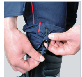
Dispositif de serrage en bas de jambes