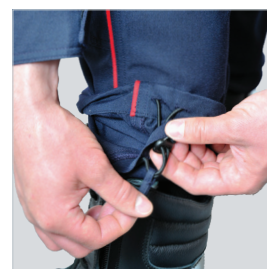
Dispositif de serrage en bas de jambes