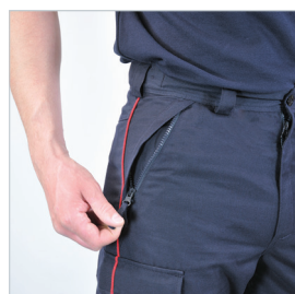
Poches biais zippées sur les côtés