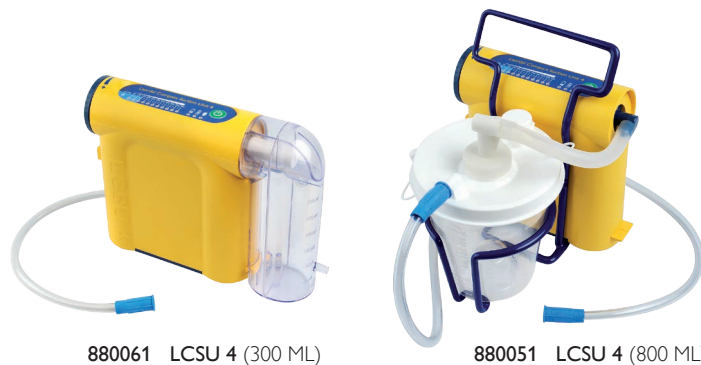
880061 LCSU 4 (300 ML)