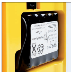
Batterie Ni/MH remplaçable, rechargeable