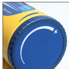
Réglage du niveau de vide 50 - 550mmHg