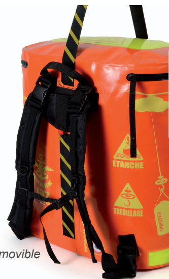
Portage dos amovible

Repères de treuillage haute visibilité (fluorescents et rétro-réfléchissants)