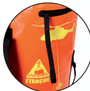
Large Zip tie