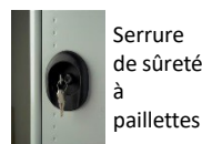
Serrure de sûreté à paillettes