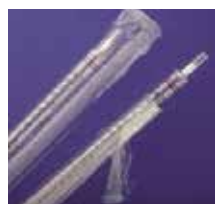
En plastique clair