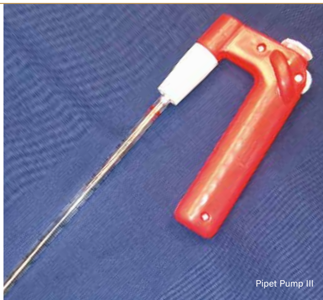
Pipet Pump III