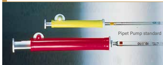
Pipet Pump standard