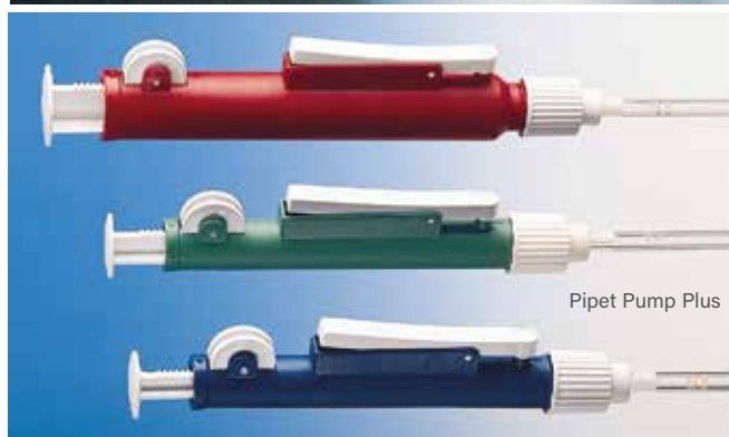
Pipet Pump Plus

Pipeteur économique manuel pour toutes pipettes de 0,2 ml à 25 ml. Par simple actionnement de la molette latérale, le Pipet Pump aspire le volume et le distribue. Le Pipet Pump Plus dispose d'une manette de distribution plus rapide et d'éjection de la dernière goutte de la pipette.