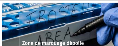
Zone de marquage dépolie