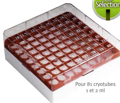
Pour 81 cryotubes 1 et 2 ml