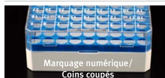
Marquage numérique/ Coins coupés