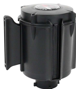
Tête à sangle 50 mm