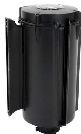
Tête à sangle 100 mm