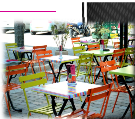
Table LORRAINE 60 X 60