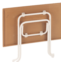
Table LORRAINE 110 X 70