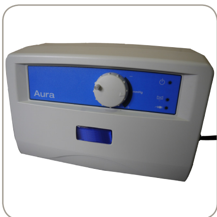
Réglage du confort