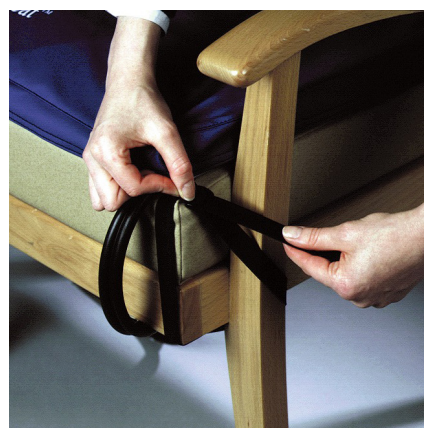
Sangles pour fixation du coussin