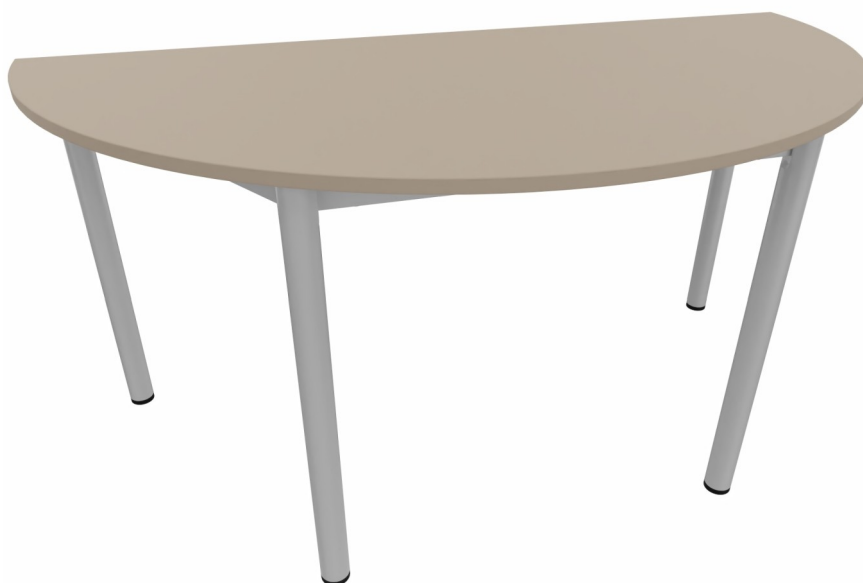
Table 4 pieds