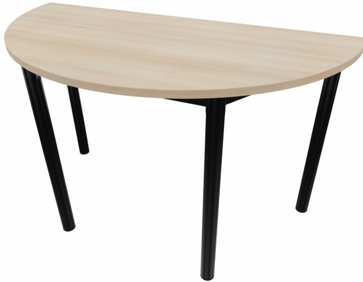
Table 4 pieds

Se réserve le droit de modifier ses produits sans préavis - document non contractuel