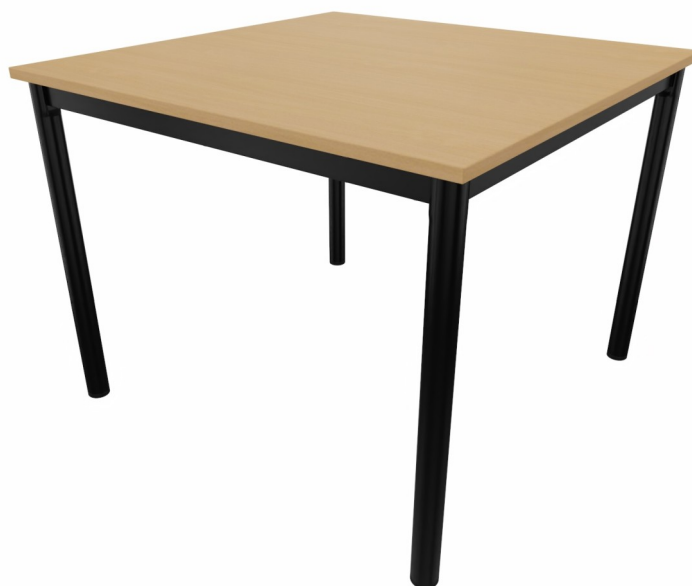
Table 4 pieds