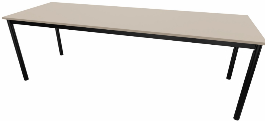
Table 4 pieds

Se réserve le droit de modifier ses produits sans préavis - document non contractuel