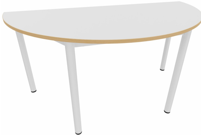
Table 4 pieds