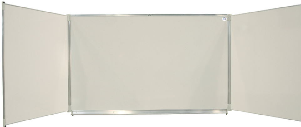
Tableau Triptyque BASIC ECO

Le plus demandé pour les salles de classe.