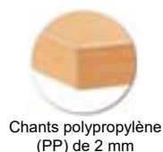
Chants polypropylène (PP) de 2 mm