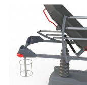
CROSO2 SUPPORT OBUS VERTICAL (INCOMPATIBLE AVEC LE BRANCARD CARVI KIDS) OPTION SUPPORT OBUS VERTICAL