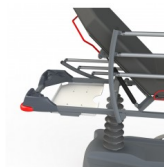
CRODOC SUPPORT DOSSIER SOUS TÊTIÈRE OPTION SUPPORT DOSSIER SOUS TÊTIÈRE