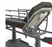
CORBE RELÈVE-BUSTE ÉLECTRIQUE À DÉBRAYAGE MANUEL (VERINS ÉLECTRIQUES) OPTION RELÈVE-BUSTE ÉLECTRIQUE À DÉBRAYAGE MANUEL (VERINS ÉLECTRIQUES)