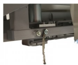
CLORA SYSTEME ANTISTATIQUE SYSTEME ANTISTATIQUE