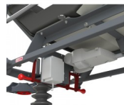
COBBA BATTERIE OPTION BATTERIE