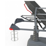
CROSO2 SUPPORT OBUS VERTICAL (INCOMPATIBLE AVEC LE BRANCARD CARVI KIDS) OPTION SUPPORT OBUS VERTICAL