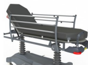
CROK7 SUPPORT CASSETTE RADIO SOUS LE PLAN DE COUCHAGE (DOUBLE PLAN DUR) (INCOMPATIBLE AVEC CORBE + CRORJ + CORJE) OPTION SUPPORT CASSETTE RADIO SOUS LE PLAN DE COUCHAGE (DOUBLE PLAN DUR) (INCOMPATIBLE AVEC CORBE + CRORJ + CORJE)