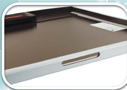
Ouverture pour connectiques