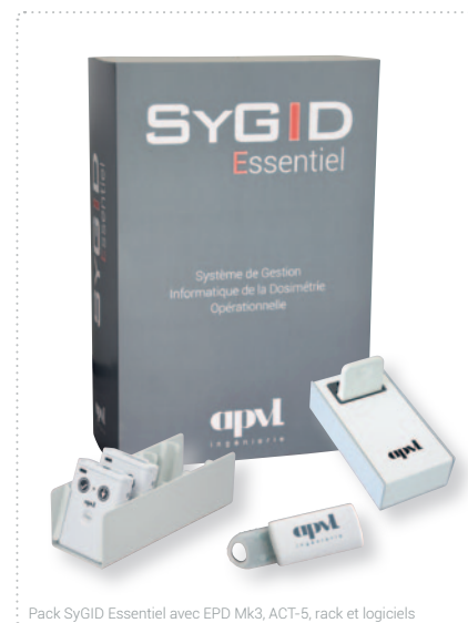
Pack SyGID Essentiel avec EPD Mk3, ACT-5, rack et logiciels

Le logiciel SyGID Essentiel fonctionne uniquement avec la borne fournie dans le pack et ne peut pas gérer d'autres bornes.