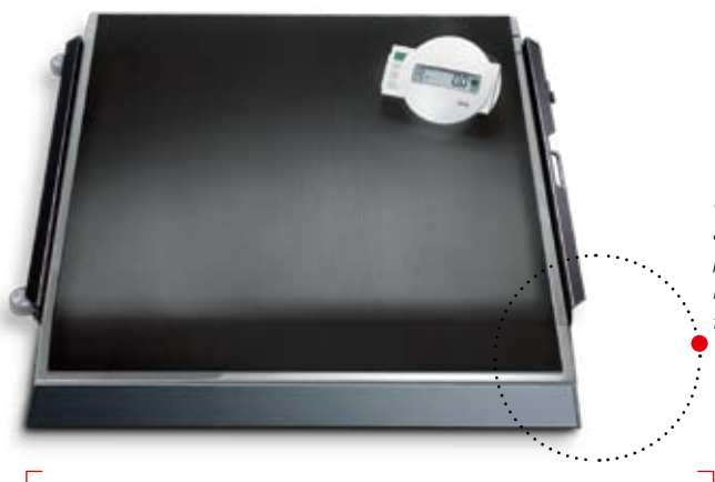
Une rampe est fournie avec la balance pour permettre aux fauteuils roulants d'y accéder facilement.