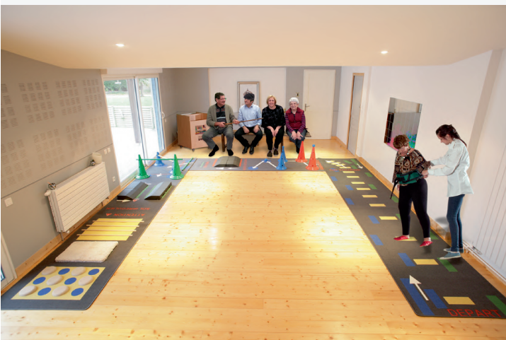
Exemple de configuration