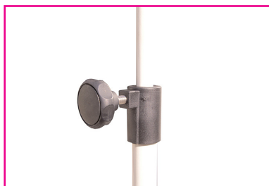
Vis de serrage