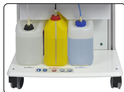
SERIE 3 version PA