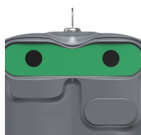
Verre Vert RAL 6010-6032