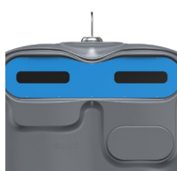
Papier Bleu Ciel RAL 5015