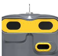
Emballage Jaune Zinc RAL 1018