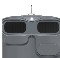
OM Gris Fer RAL 7011