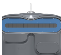
Carton Bleu Distant RAL 5023