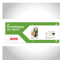
Consignes De Tri (exemple)