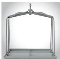
Kinshofer Flex sans système de rotation + nouvelle structure interne