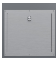
Trappe Gros Producteur