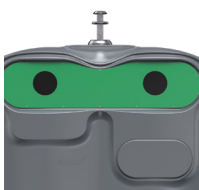
Verre Vert RAL 6010-6032