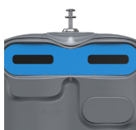
Papier Bleu Ciel RAL 5015 ref. 4001904 HUBL'O 4000 P K