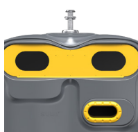
Emballage Jaune Zinc RAL 1018 ref. 4001908 HUBL'O 4000 EMR K