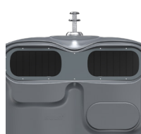
OM Gris Fer RAL 7011 ref. 4001910 HUBL'O 4000 OMR K