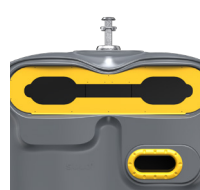
Extension Consignes De Tri Jaune Zinc RAL 1018