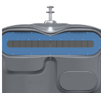
Carton Bleu Distant RAL 5023 ref. 4001906 HUBL'O 4000 C K